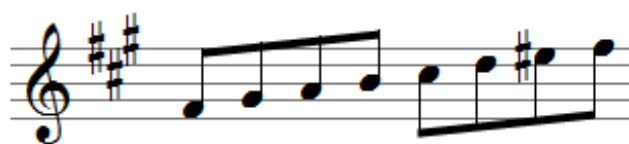
fis Moll harmonisch